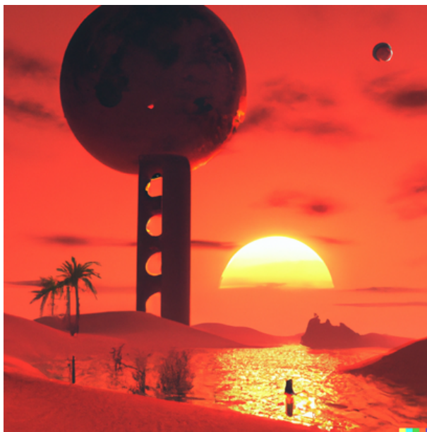
Image générée sur Dall.e.

< Photo d'une plage sur la planète Mars, à côté d'une tour futuriste au coucher de soleil. On voit des palmiers, des personnes qui nagent et la Lune. >